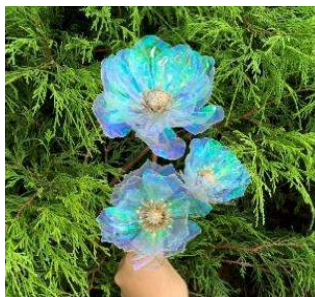
オーロラ フラワー 昼