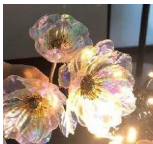
オーロラ フラワー 夜