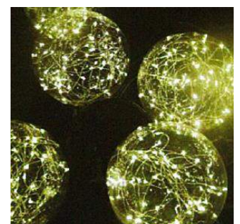
ビーズ in ボール