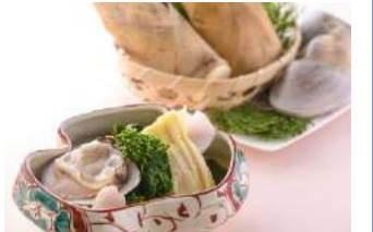
4F 尾張 三ぶん