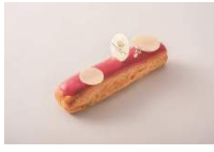
B1F ピエール マルコリーニ