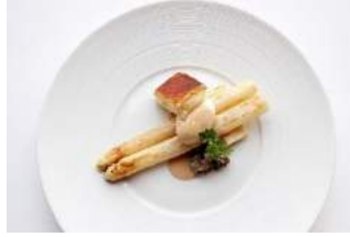
42F オーベルジュ・ド・リル ナゴヤ

【周年記念メニュー】 和牛ヒレ肉のピリ辛炒め～紹興酒風味～ ¥3,600 (税サ抜)