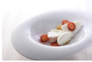
42F エノテーカ ピンキオーリ

イチゴのクレモーズとクーリ ミルクのジェラート 軽いメ レンゲ ¥1,500 (税サ抜)