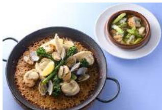
4F バル デ エスパージュ ムイ

アスパラガスとホタテのアヒ ージョ ¥1,300 ホタテとアサリと緑野菜のパ エジャ ¥3,600 (各税込)