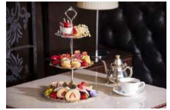
B1F サロン・ド・モンシェール