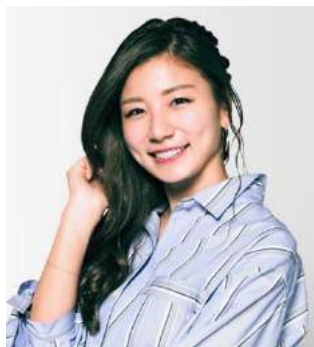
青木愛 Ai Aoki