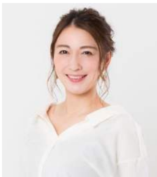
小椋久美子 Kumiko Ogura

地元の名門クラブ・京都踏水会で水泳をはじめ、8歳から本格的にアーティスティックスイミングに転向。2005年日本代表初選出。2006年ワールドカップ フリーコンビネーション銀メダル、チーム銀メダル。アジア大会チーム銀メダル。2007年世界選手権代表。2008年北京オリンピックチーム5位入賞。