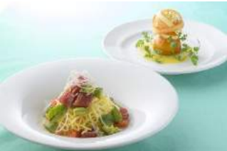
4F ピッツェリア イゾラ

牛モモ肉の薄切りステーキ サラダ仕立てとたっぶりチー ズ ¥1,500 (税抜)