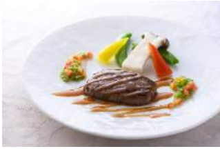
42F 中国飯店 麗穂

【周年記念メニュー】 和牛ヒレ肉のピリ辛炒め～紹興酒風味～ ¥3,600 (税サ抜)