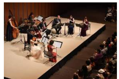
koji吉ダンスウィング・オールスターズオーケストラ