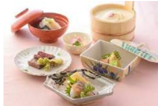
4F 松山閣 松山

【周年記念メニュー】 京の春懐石 ¥10,000、¥12,000、¥15,000 (各税込)