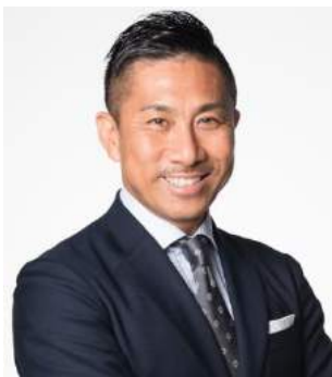
前園真聖 Masakiyo Maezono

8歳の時、地元のスポーツ少年団でバドミントン始める。2002年全日本総合バドミントン選手権シングルス優勝後、潮田玲子氏とペアを結成しダブルスプレーヤーへ転向。全日本総合バドミントン選手権では2004年から2008年まで5連覇。2008年北京オリンピック5位入賞。