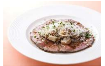
4F 文化洋食店nouveau (ヌー ヴェオ)

牛モモ肉の薄切りステーキ サラダ仕立てとたっぶりチー ズ ¥1,500 (税抜)