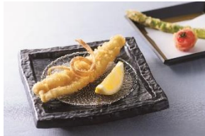
4F 宴 ハゲ天

Anniversary Plan 2名様 ¥26,000(税サ込) 6月1日～期間限定(ディナーのみ) ※3日前までに要予約