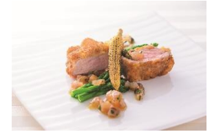
42F エノテカ ピンキオーリ

白アスパラガスとトマトのすき焼～ 初夏～ ¥14,850～、コース ¥18,176～(各 税サ込) ～6月30日期間限定 ※写真はイメージです。写真のすき焼 のお肉・お野菜は2名様分です