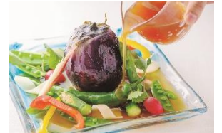
4F 蔵人厨 ねのひ

イサキのマリネとフルーツマトの冷製パスタ ズップ仕立て ¥2,000(税込) 6月1日～7月中旬期間限定(ディナーのみ)