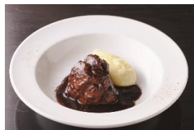
B1F ベーカリー&レストラン 沢村

手作りタイグリーンカレーセット ¥411、ジャスミンライス(300g入り) ¥389(各税込) ※写真は調理後のイメージです ※鶏肉、野菜などの具材を用意して調理してください