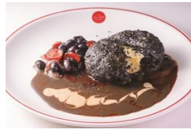
4F 文化洋食店nouveau(ヌーヴオ)

岩牡蠣と夏野菜のカクテルソース ¥1,260(税抜) 6月1日～期間限定(ディナーのみ)