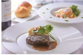
4F バロン ザ ステーキ

「夏祭2019」期間中のミッドランドスクエアは、身体にも美容にも美味しい夏グルメをご提供しています。