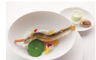
42F オーベルジュ・ド・リル ナゴヤ

魚介の踊り焼と極上牛季節コース 青葉 ¥28,512～(税サ込) ～6月30日期間限定 ※写真はイメージです