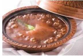
41F 中国飯店 麗穂

鱧と夏野菜のサラダ仕立て ¥1,480 スイートコーンとゴーヤのかき揚げ ¥780(各税抜) 夏季限定(ディナーのみ)