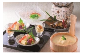
4F 松山閣 松山

10種類の夏野菜とオマール海老テリヌ 活帆立のグリル添え ディナーコース ¥7,500(税込)の一品 ～7月31日期間限定(ディナーのみ)