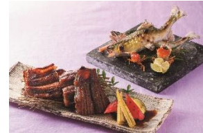
4F 尾張 三ぶん

穴子一本揚げ ¥930 ミニマト ¥410 アスパラ ¥515(各税込) ディナー限定 ※写真はイメージです