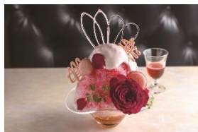
B1F サロン・ド・モンシエール

エディブルローズのかき氷 ¥1,620(税込) 夏季限定 ミッドランドスクエア店限定