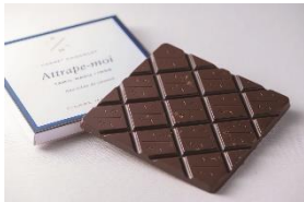
B1F ピエール マルコリーニ

「夏祭2019」期間中のミッドランドスクエアは、身体にも美容にも美味しい夏グルメをご提供しています。