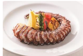
4F バル デ エスパーニャムイ

日間賀島・活タコの網焼きと夏野菜添え ¥2,300(税込) 6月1日～7月中旬期間限定(ディナーのみ)