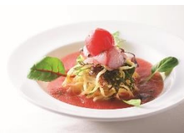
4F ピッツェリア イゾラ

エディブルローズのかき氷 ¥1,620(税込) 夏季限定 ミッドランドスクエア店限定