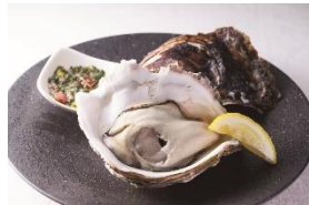
B1F ラスール オーバカナル

岩牡蠣と夏野菜のカクテルソース ¥1,260(税抜) 6月1日～期間限定(ディナーのみ)