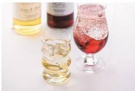
B1F ディーン&デルーカ