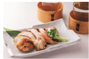
4F 名古屋 今井屋本店

鮎のコンフィー 瓜と茄子のコン ポート コンソメジュレと枝豆の冷たいヴ ルーテ 鮎のうるかのタブナド クルトン添 え ディナーコース ¥10,000(税サ抜) の一品 7月～9月ディナータイム限定