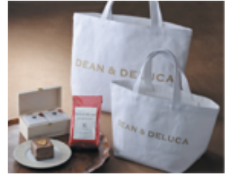
ディーン&デルーカ ホリデートート S 2,100 円 M 2,520 円 ★Xmas 限定