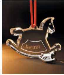
バカラ クリスマス オーナメント 15,750 円 ★Xmas 限定