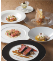
エノテーカ ピンキオーリ Menu di Natale 22,000 円 ★期間限定