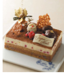
サロン・ド・モ ンシュシュ エレガント・ ティラ 2,940 円 ★Xmas 限定