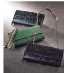
<賞品一例> フェリージ チェーンウォレット

期間中、メンバーズ加盟店舗で5,000円以上(税込)ご購入・ご飲食いただいたメンバーズカード会員様の中から抽選で「Xmas Book」掲載の商品をプレゼントいたします。 なお、メンバーズカード会員でない方でも、ご入会いただければ、すぐにご応募いただけます。