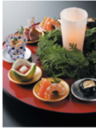
京都吉兆 会席料理 11,550 円 ★期間限定