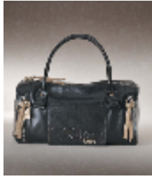
クロエ ECLIPSE 105,000 円 ★Xmas 限定 ★日本限定