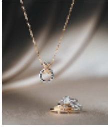
ショーム プルミエ・リアン ウェディングリ ングペンダント 208,000 円 ★Xmas 限定